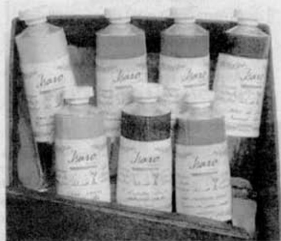
Isabelle Roelofs dispose d'une gamme de 27 couleurs